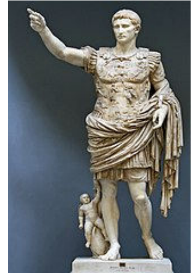
Auguste de Prima Porta

Au temps de Jésus, la Judée est sous domination de l'empire romain sous le règne de César Auguste. Cet empereur est puissant : il a le pouvoir de commander les armées, de faire des lois, de s'opposer à une décision qui ne fait pas son affaire, de faire des réformes politiques à son avantage. Il est vénéré comme un dieu. En d'autres mots, il est le maître du monde romain.